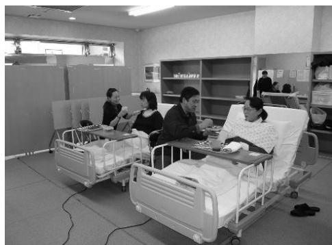
☆介護演習の様子 (食事介助)

◇訓練内容等については、ご来社いただいでのご説明が可能です。まずはお気軽にお電話ください。