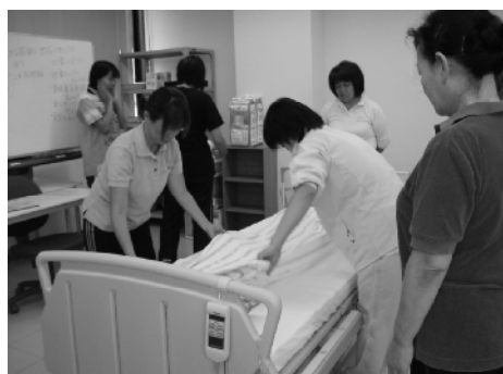
☆介護演習の様子 (ベッドメイキング)